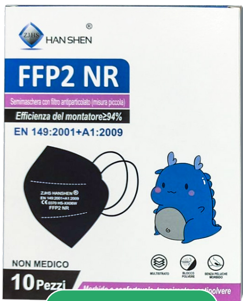
Box 10 pezzi